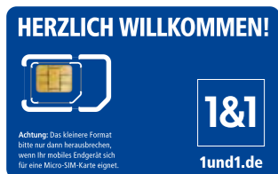
Trägerkarte Kombi-SIM (enthält Mini- und Micro-SIM)

Je nach benötigtem Format werden die 1&1 SIM-Karten auf unterschiedlichen Trägerkarten verschickt. Sie haben eine der beiden abgebildeten Trägerkarten erhalten.