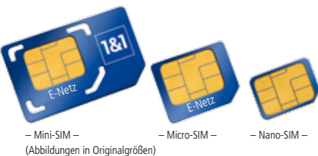
– Mini-SIM – – Micro-SIM – – Nano-SIM – (Abbildungen in Originalgrößen)

Lösen Sie die SIM-Karte vorsichtig aus der Trägerkarte heraus.